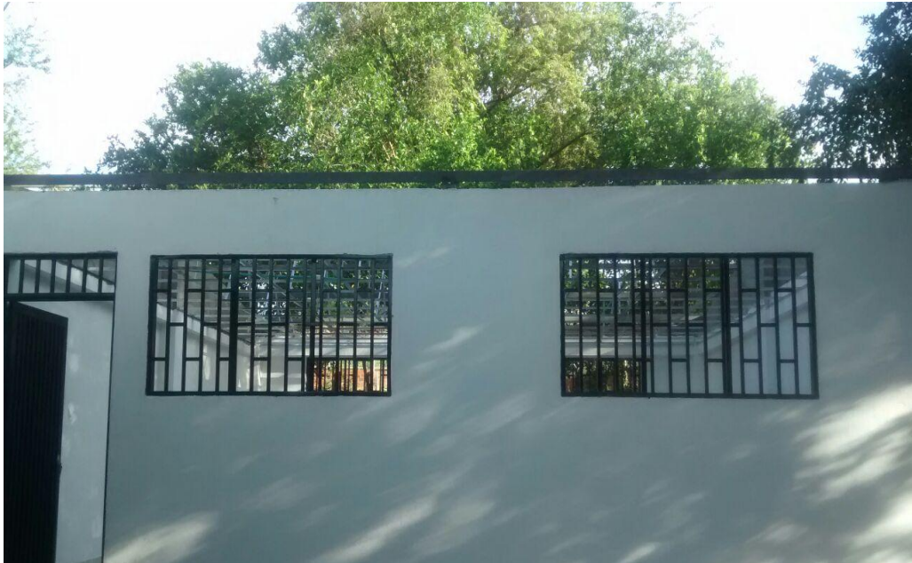
Imagen 2. Aulas terminadas

y especificaciones; también durante estas visitas se le aclaraban dudas y de igual forma se hacían correcciones si las hubiera al maestro quien estuvo en frente de la misma, también se tomaron muestras de concreto para ser llevadas a laboratorio y luego ser falladas, con el fin de poder verificar la resistencia que exigen en las especificaciones de acuerdo a cada estructura.