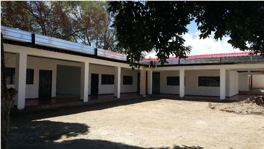
Imagen 3. Terminación de la obra “Hogar Infantil La Asunción”