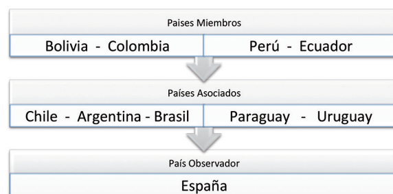
FIGURA 1. Países de la CAN. Elaboración propia con base en Comunidad Andina de Naciones-CAN. [2016, noviembre]. Comunidad Andina de Naciones. Comunidadandina.org . Recuperado de http://www.comunidadandina.org/Seccion.aspx?id=189&tipo=QU&title=somos-comunidad-andina

Como se puede observar, los objetivos de la CAN se enfocan en cooperación de tipo político, social, cultural y económico, y apoyan el desarrollo del comercio internacional entre los países miembros. Una particularidad de esta regionalización es que cuenta con un número aproximado de igualdad de países miembros con relación a Mercosur, de manera que es un grupo muy importante para Latam.