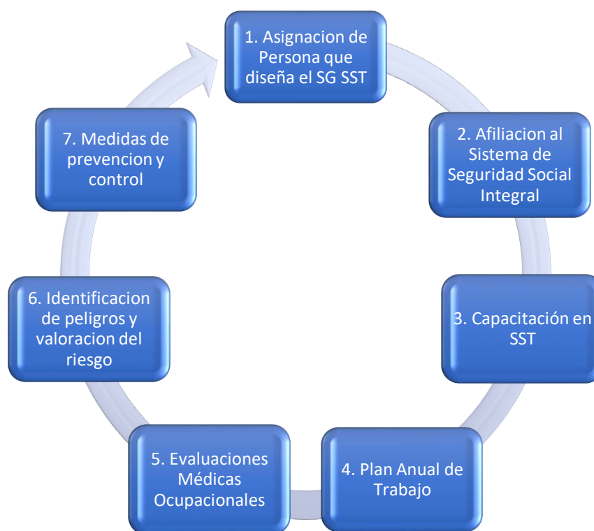
Grafica 2: Ítems de Obligatorio cumplimiento en la Resolución 0312 de 2019 para empresas de diez (10) o menos trabajadores clasificadas en riesgo I, II, III.