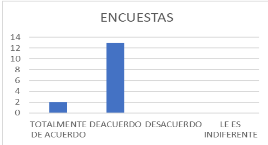
Figura 2. Encuestas de las empresas del sector agropecuario.